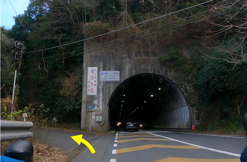
No23：赤根トンネル迂回