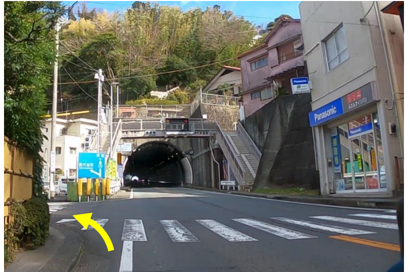
No24網代S：網代トンネル迂回