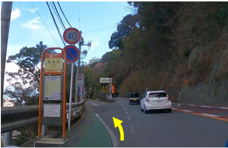
No21：錦ヶ浦トンネル迂回