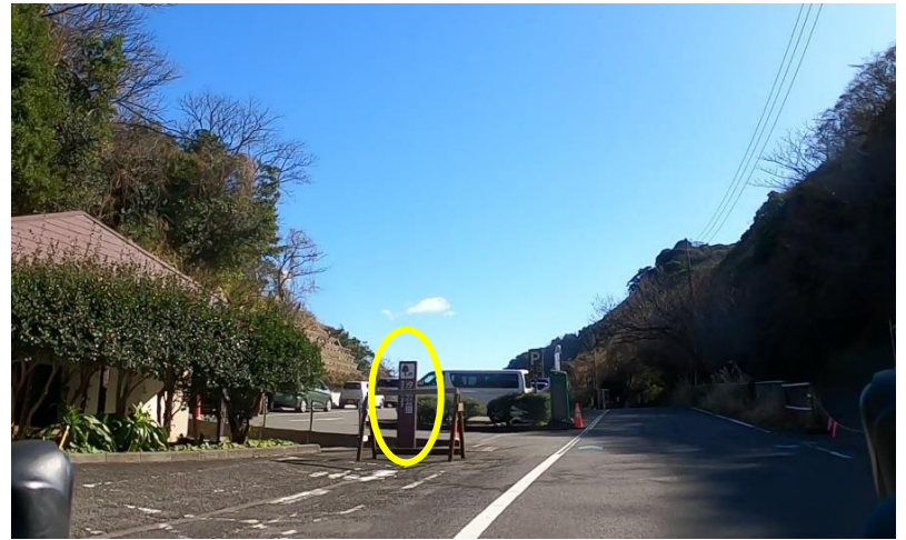
No28通過チェック：写真撮影