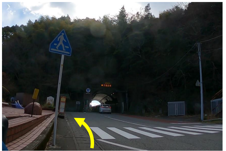
No22：錦ヶ浦トンネル迂回～国道復帰～次の迂回