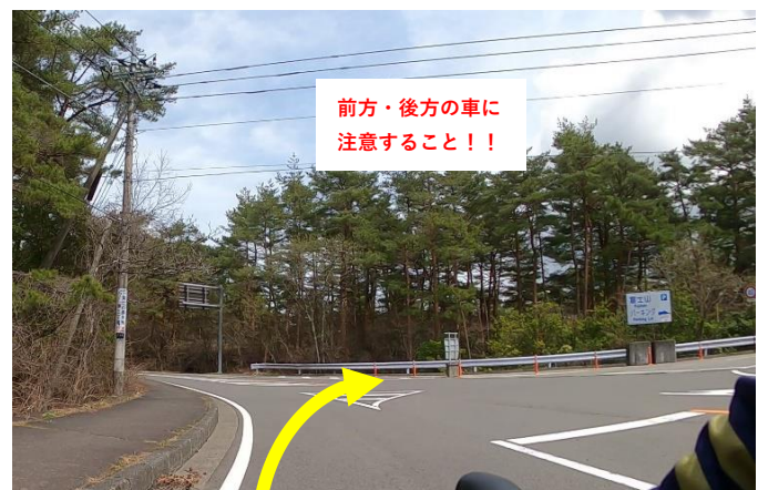
写真10 (注意して右折)