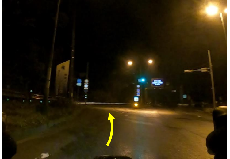
写真3 (生土S 左方向へ)