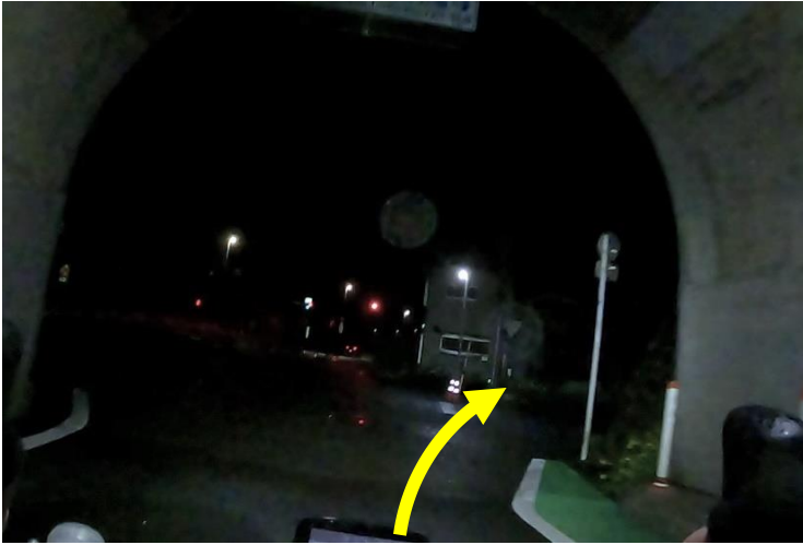
写真2 (トンネル出口から真ん中の道路へ)