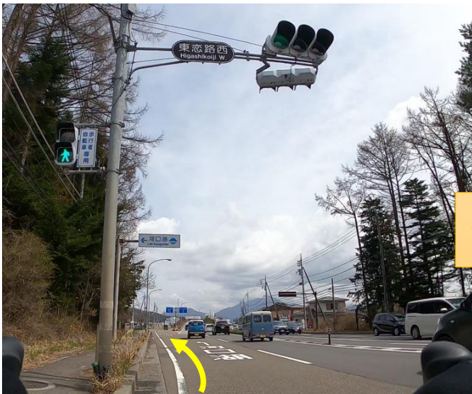
写真8 (東恋路西の先、側道左方向)

東恋路西Sの先の側道左方向に進んでください。その先が東恋路Sです。(写真8,9)