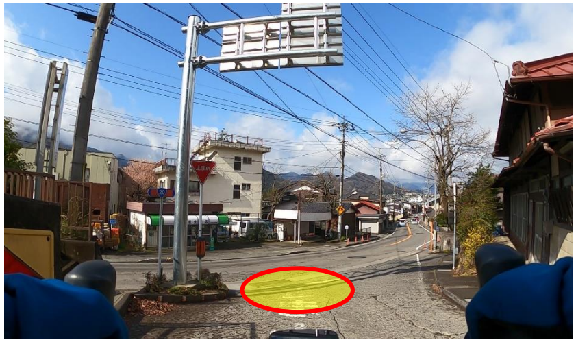
写真5 (国道20号に出る手前の赤枠付近)

国道20号に出る手前が急坂になっている。 路面も相当荒れている。(写真5→) 私は自転車を降りて押し歩きました。