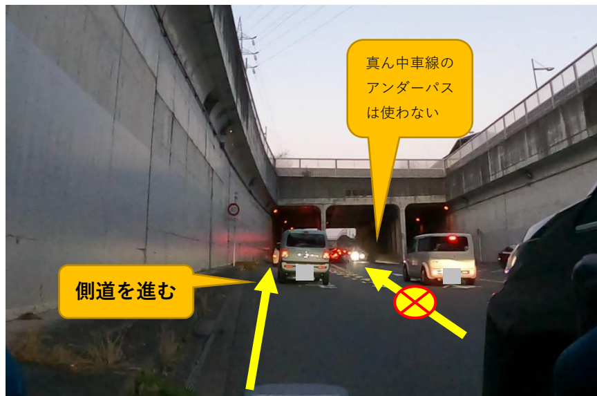
写真8 (左車線の側道を進む)