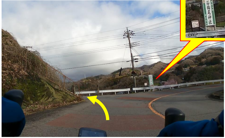
写真4 (下り右カーブの途中を左折)

下り右カーブの途中を左折。(写真4→) 気分よく下っているとすっかり見過ごす ので注意。 私は気分よく右方向へミスコースしました。 (写真は一度戻って撮影したものです)