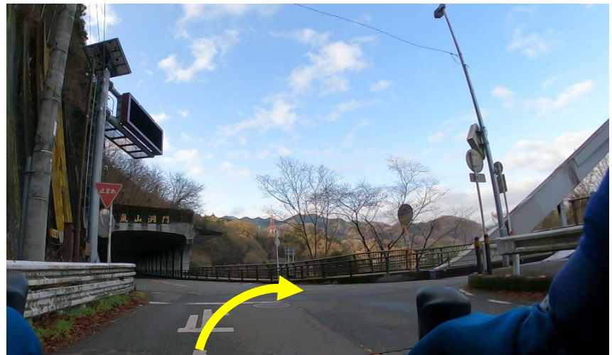
写真3 (相模湖大橋へ)