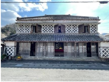
伊豆文邸と隣にある足湯