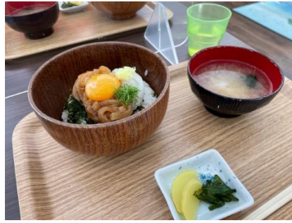
仁科漁港の沖あがり食堂で「イカ様丼」いただきました

(ウ) #33 K121 から町道へ左折する箇所がわかりづらいのですが、横断歩道手前を左折です。