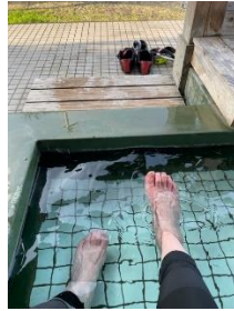
梅月園と店の向かい側にある足湯