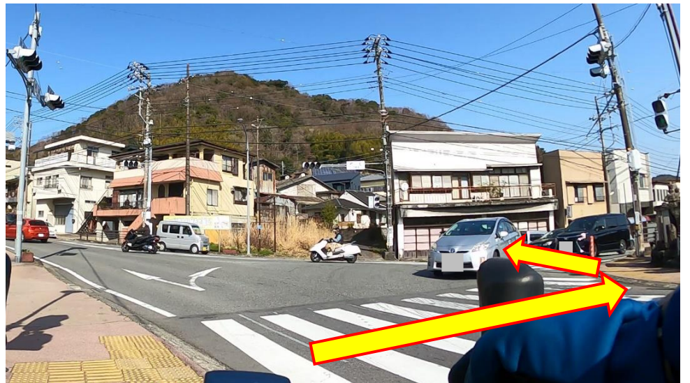
写真2 (横瀬S 二段階右折)

横断歩道を使って二段階右折する。(写真2→) 2つめの歩行者信号は待機スペースが狭い。 歩行者の邪魔にならないよう待機すること。