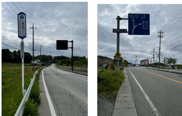
(右) #70 JA 梨北小淵沢支所前 S