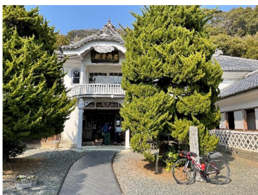
重要文化財岩科学校

⑥ #37～44: 県道から外れて生活道路に入ります。注意して走行してください。