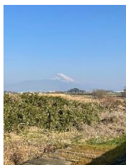
狩野川 CR から見える富士山

② #7～#9:狩野川サイクリングロード(CR)を通ります。CR は工事中だが通行は可、ゲートをくぐれない場合は脇の道を CR に沿って進みます。石堂橋で対岸に渡り CR を走行します。