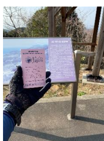
フォトチェック: 石部の棚田展望台

⑦ #45-50: マーガレットライン、雲見海岸から松崎にかけては西伊豆のダイナミックな景観を楽しめます。松崎ではなまこ壁の街並を楽しんでください。