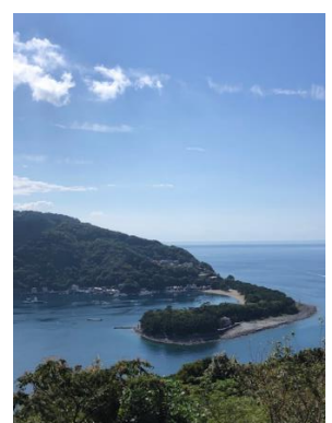
戸田の御浜岬を望む