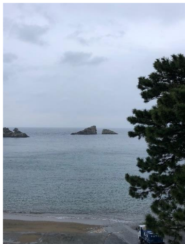
雲見海岸より沖磯「牛着岩」を臨む

No.33-35 妻良、小浦、伊浜を経てフォトチェックポイントのある雲見海岸へ。この区間のアップダウンも思いのほか脚にきますが、海岸沿いでは西伊豆の海岸美、透き通る海を垣間見るでしょう、わき見運転はダメですけど。指定された場所でブルベカードの氏名を入れた写真を撮ってください。