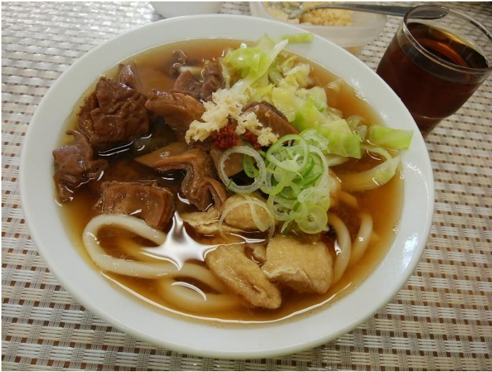
馬もつ煮うどん @吉田うどん東屋