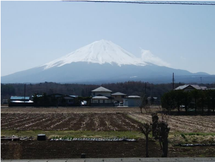
北からも富士山ドーン @鳴沢

No.39 ひばりが丘 S を右折すると今度は北からの富士山の眺めを楽しめます。 が、交通量も増えるのでよそ見は気を付けて。