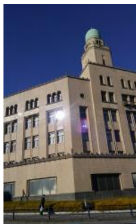
中央:ジャックの塔 (横浜開港記念館)