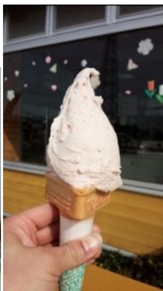
朝霧高原いちごのジェラート♪