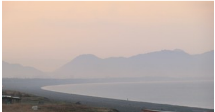
図 3: 実は海側は朝日に焼けて山紫水明に

すると左右同じ時間とは思えない風景が・・・。寄ってよかった。朝焼けはほとんど終わっている所でしたが、これなら食事を後回しにして日の出を海岸線で待ち構えるというのも写真目的ならいいかもしれません。