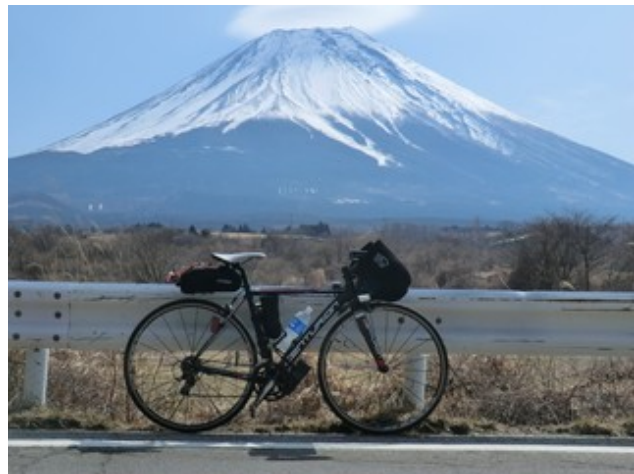
図 4: 山天気!! 劇的ビフォー→アフター