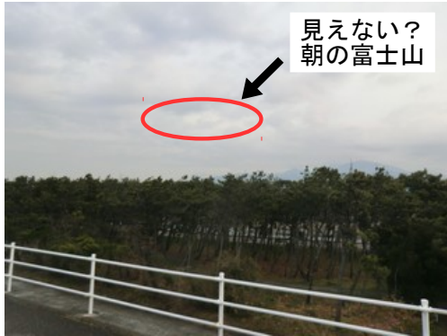
図 2: 少しだけ見えた富士

試走日は空一面が灰色でこれは富士山観光は無理だな・・・という天気だったのでふといつも走っている千本松原の反対側の海側でも見てみようと寄り道してみました。